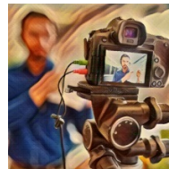
La PAC en la sociedad