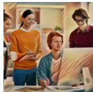
La PAC en un click