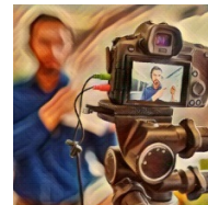
La PAC en la sociedad