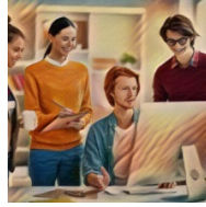
La PAC en un click