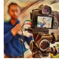
La PAC en la sociedad