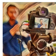
La PAC en la sociedad