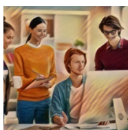
La PAC en un click