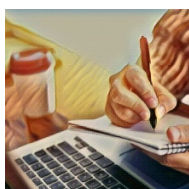
La PAC en general

En nuestra web dispondrás de toda la información de las actividades del proyecto y de las últimas novedades de la PAC 2023-2027. Tendrás acceso a cursos y videos divulgativos, así como a una aplicación pensada para rentabilizar las explotaciones agrícolas y también a seminarios prácticos; tanto para usted como el personal de UPA como para todos sus asociados y asociadas.