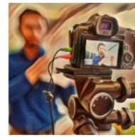
La PAC en la sociedad