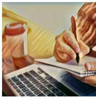
La PAC en general