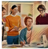
La PAC en un click