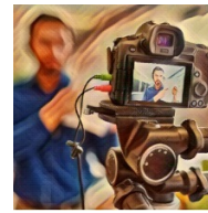
La PAC en la sociedad