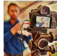
La PAC en la sociedad