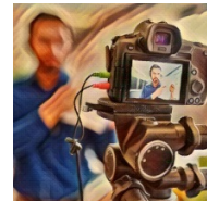
La PAC en la sociedad