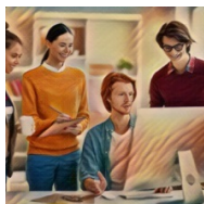
La PAC en un click