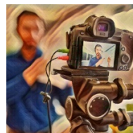
La PAC en la sociedad